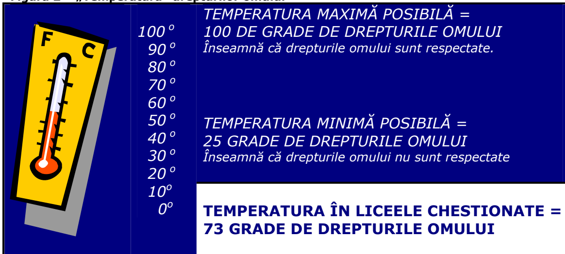
Figura 2 – „Temperatura” drepturilor omului

73 grade de drepturile omului înseamnă că în liceele chestionate elevii consideră că drepturile lor și ale celorlalte persoane din comunitatea lor școlară sunt respectate în mare măsură.